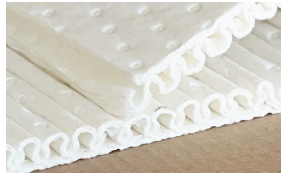
Tissue Paper - Ouate de cellulose La version SOFT absorbante et non abrasive