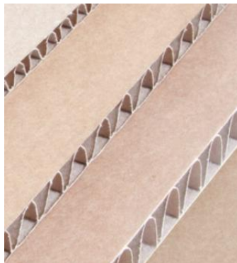
cArtù : triple couche