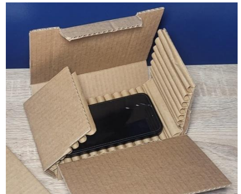
La Wave Box, prête à l'emploi

- 70% d'émissions de CO2 par rapport à la production d'emballages traditionnels en plastique